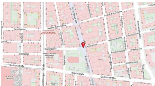
Keplerplatz U-Bahn station