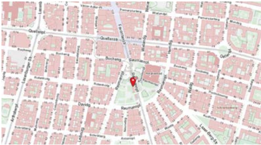
Reumannplatz U-Bahn station