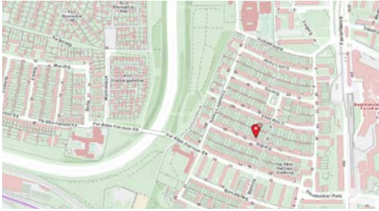
Per Albin Hansson Siedlung Per Albin Hansson Straße