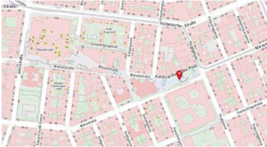
Wasserwelt Kardinal-Rauscher-Platz, 1150 Wien