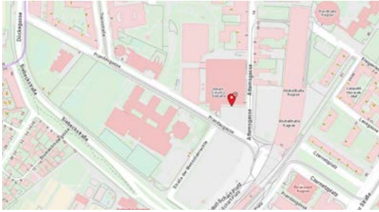
Erste Bank Arena Attemsgasse 1, 1220 Wien