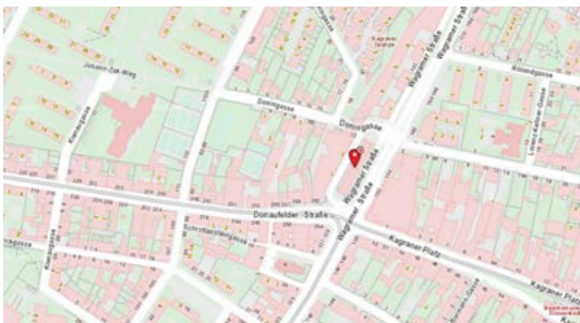
Kagraner Platz U-Bahn Station