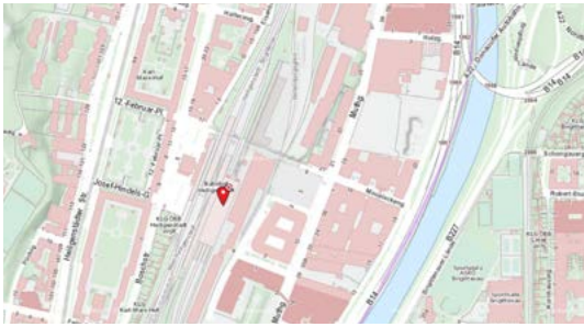
Heiligenstadt U-Bahn station